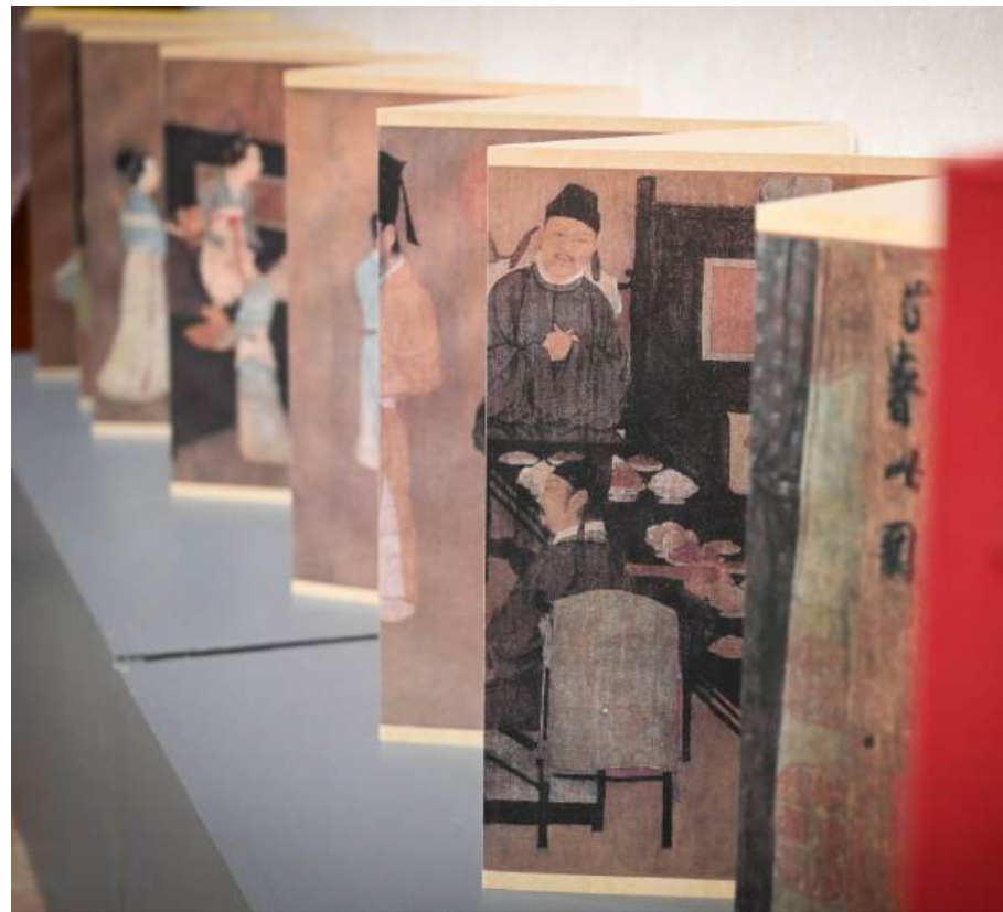
Rollo plegable horizontal