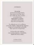
La estampa tenía en el reverso la oración del Acordado, atribuida a san Bernardo (s.XII), en chino.