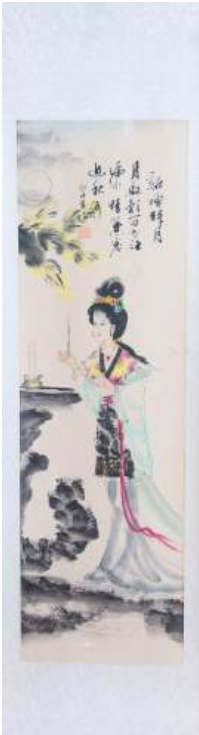
母聖華中 Nuestra Señora Madre de China