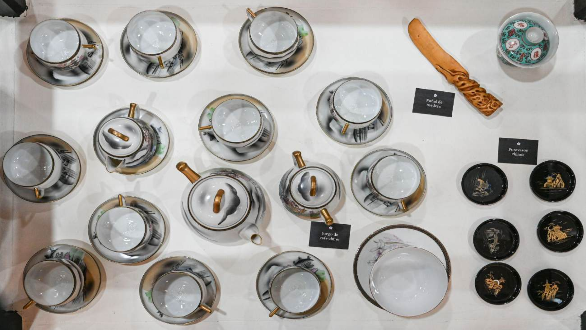
★ Puñal de madera