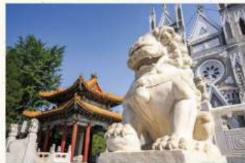
Múltiples leones tallados en piedra se yerguen delante de la fachada