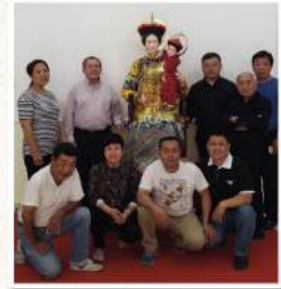
Un pequeño grupo de fieles le recibe con alegría y expectación y se encargan de ensamblarla, vestirla e instalarla en la sacristía.