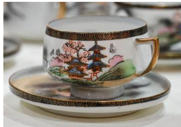
Juego de café chino Puñal de madera Posavasos chinos