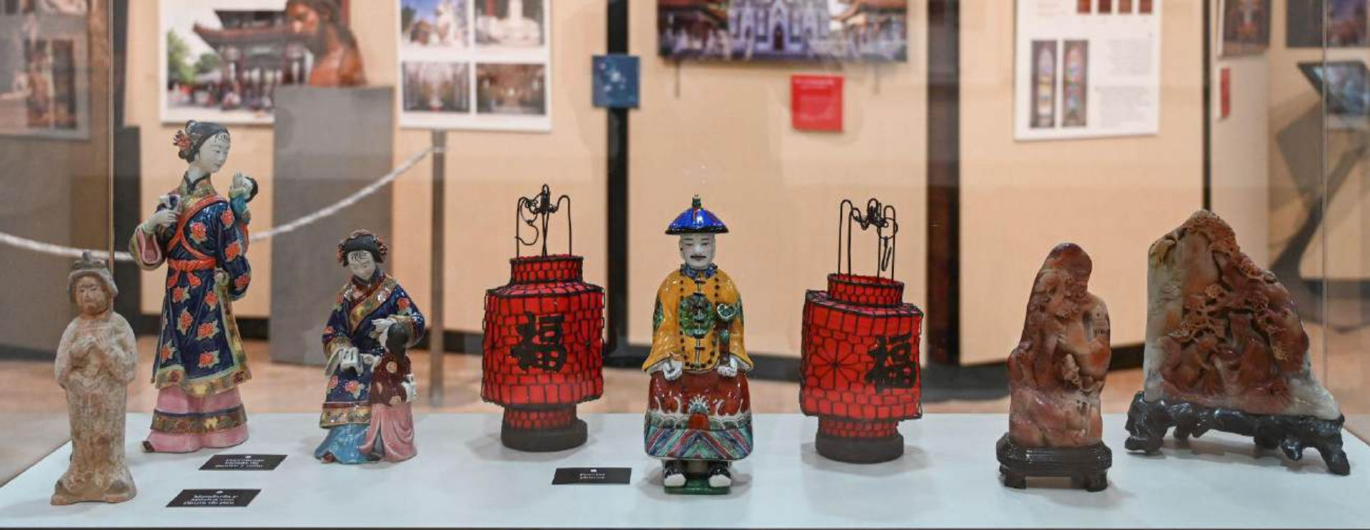
Porcelanas chinas de madre y niño Música con flauta de pan Piedras esculpidas chinas Mandarín Faroles chinos