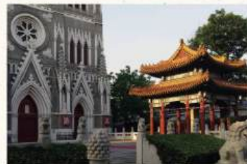
Los jardines están salpicados de jarrones y dos pabellones que flanquean la fachada principal