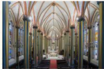
La actual catedral neogótica es de 1890, dirigida por el misionero Pierre-Marie-Alphonse Favier