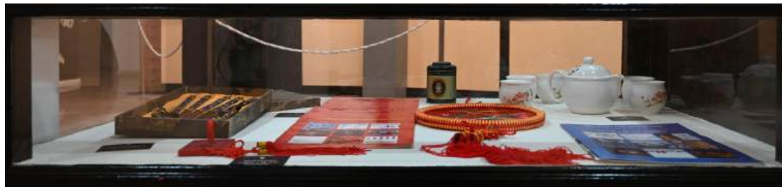
Anuario sobre China Palillos chinos en estuche Madera para colgar y de uso funerario Bordado de seda Juego de té chino