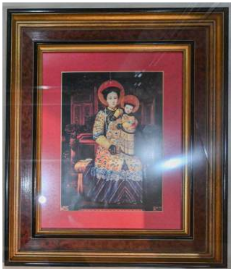
Pequeño icono de la Virgen Rosario chino Abanicos