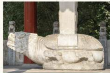
Basamento que sostiene la placa caligráfica del Emperador, con el título "Iglesia del Salvador"