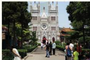
El acceso a la catedral se produce a través de unos jardines