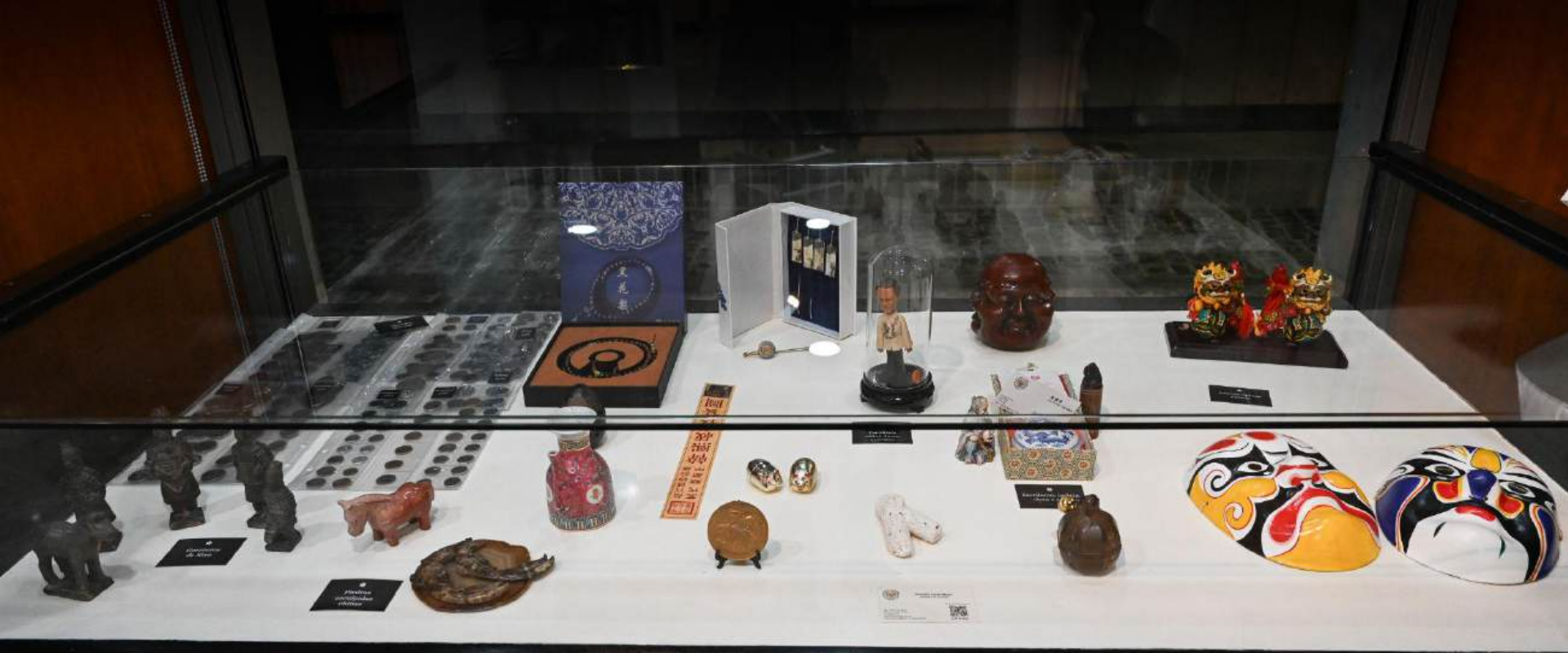
Monedas asiáticas Escribano, tarjeta, tinta y sello Dinero mortuario chino de papel para quemar Escultura china de un europeo