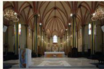
A la izquierda del presbiterio se encuentra la nueva capilla de Nuestra Señora Madre de China