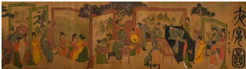
Rollo horizontal con escenas chinas