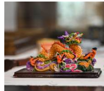
Figurita de piedra Dragón